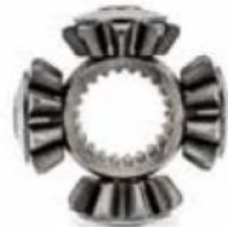
کیت چرخ‌دنده دیفرانسیل