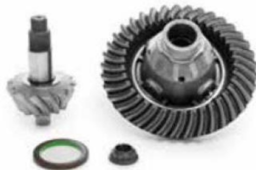
ست چرخ‌دنده محرک دیفرانسیل